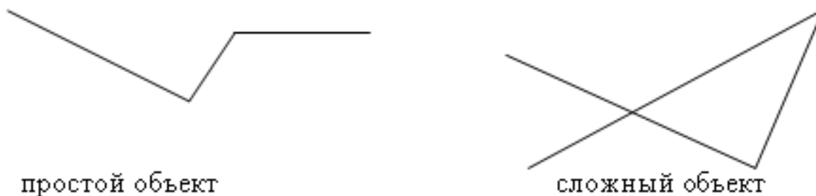
Рисунок 2. Примеры геометрического объекта

Проверка сложности геометрического объекта. Описание каждого инстанцируемого геометрического класса включает условия, при которых элемент, принадлежащий этому классу, классифицируется как простой или не простой (сложный). Как правило, простота или сложность объекта зависит от наличия точек пересечения или линий соприкосновения элементов объекта, например, рисунок 2 .